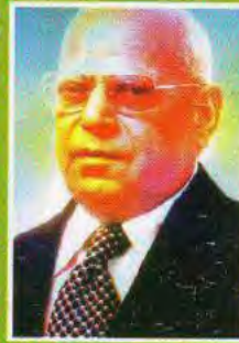
स्व० पद्मविभूषण धर्मवीर जी