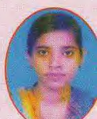
Khakashan Anjun 68.44% in Urdu