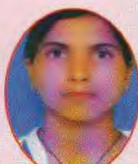
Himanshi 77.08% in Home Sci.