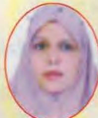
Massom Raza 77.4% in Urdu