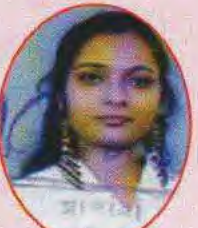
Tewesha Tank 69.05% in Mass Com.