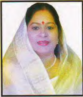
अध्यक्ष श्रीमती रुचि वीरा विधायक, बिजनौर